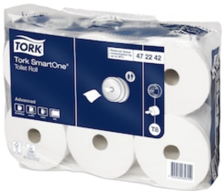
Tork SmartOne T8 Adv C. igien. 1150 str 472242